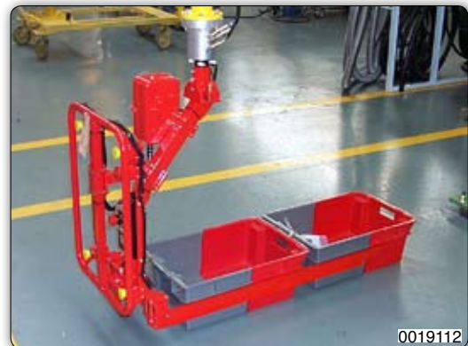
Ruční manipulátor s vidlicovým zařízením pro uchopení přepravek a manipulaci s nimi.