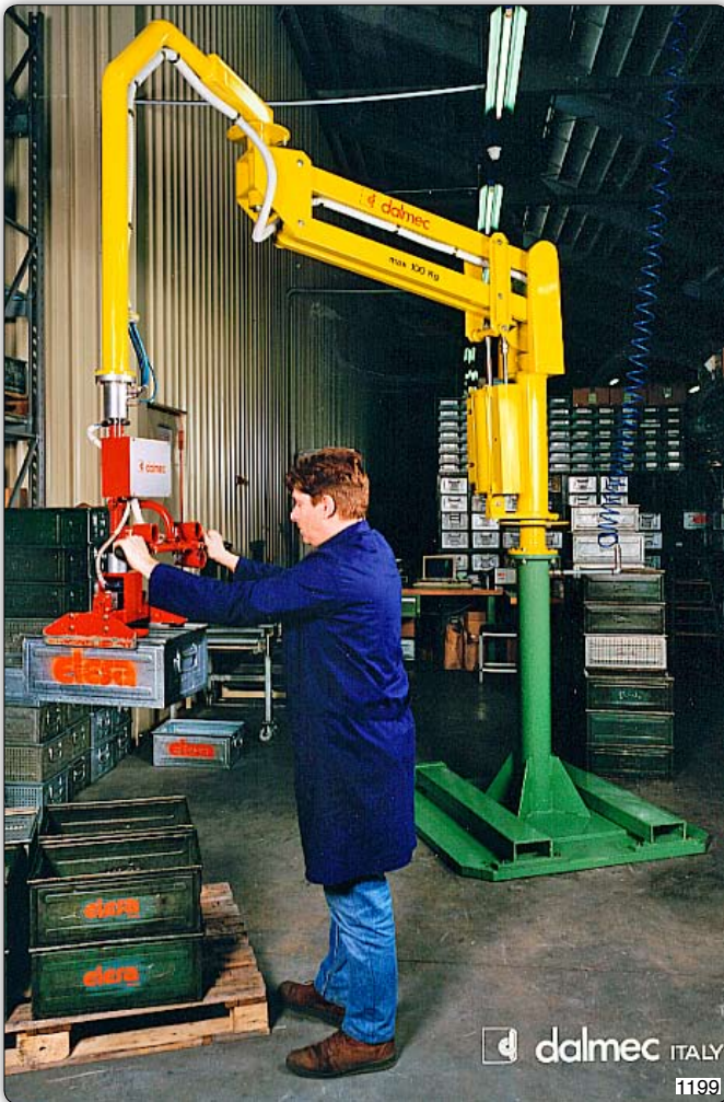
Ruční manipulátor „Partner“ typ PMC, sloupový přístroj na pojízdné základní desce, s úchopním zařízením k překládání přepravek.