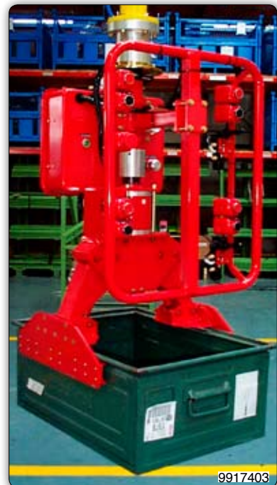
Ruční manipulátor s pneumatickým drapákem pro uchopení a pneumatické vyprázdnění přepravek.