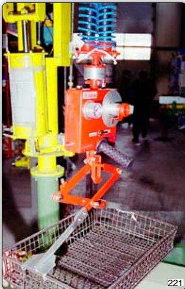
Ruční manipulátor s pantografem pro manipulaci s kovovými koši.