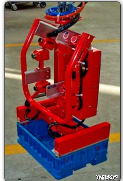
Ruční manipulátor s drapákem pro uchopení za horní okraj přepravky.