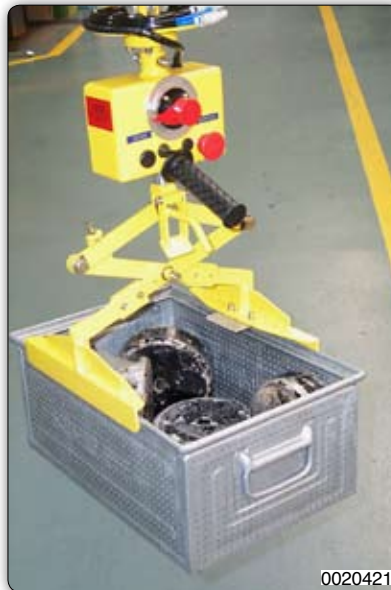
Ruční manipulátor s pantografem pro manipulaci s přepravkami.