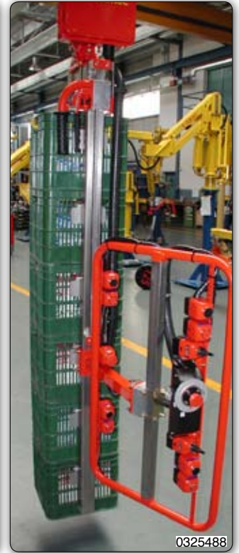
Ruční manipulátor „Partner“ stropní přístroj pojezdový v kolejničích, s pneumatickou motorizací, s různými regulovatelnými háky k manipulaci s 1 až 8 bednami pro nápoje různých velikostí.