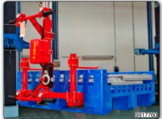
Ruční manipulátor s úchopním zařízením pro manipulaci s plastovými přepravkami.