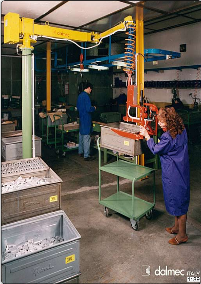
Ruční manipulátor „Posifil“ typ PFC, sloupový přístroj s vidlicovým zařízením pro manipulaci s kovovými přepravkami.