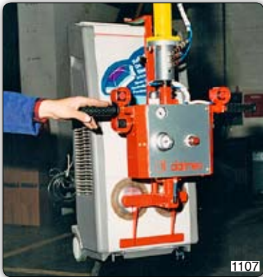
Přísavky k uchopení a manipulaci klimatizačních zařízení. 1107