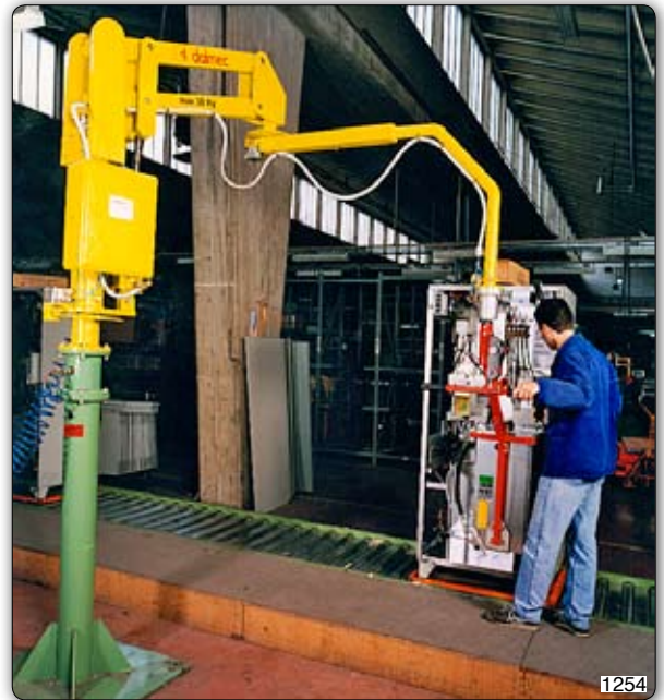
Ruční manipulátor „Partner“ typ PMC, sloupový přístroj s vidlicovým zařízením k manipulaci s díly nápojových automatů. 1254