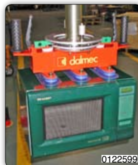
Přisavní zařízení k uchopení elektrických trub a manipulaci s nimi.