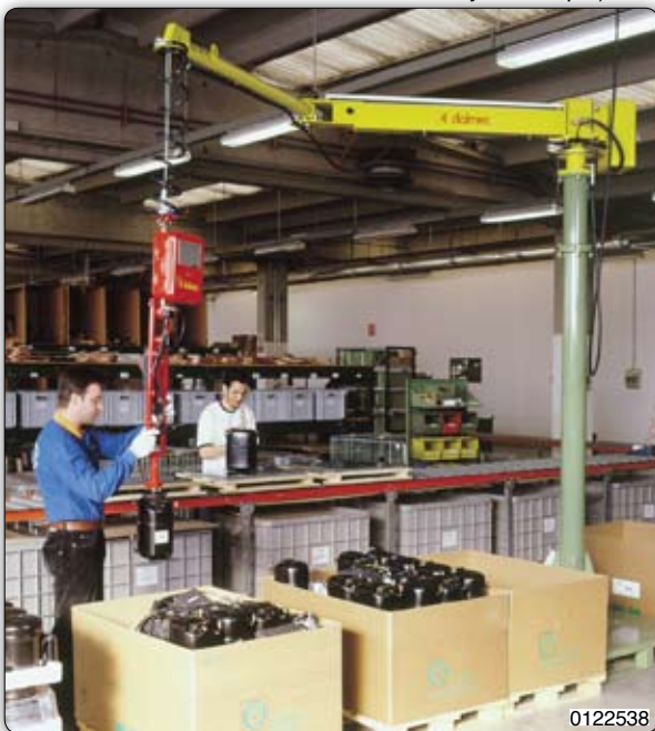
Ruční manipulátor „Posifil“ typ PFC, sloupový přístroj vybaven přísavným zařízením pro manipulaci s kompresory chladniček. 0122538