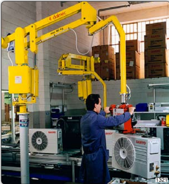
Ruční manipulátor „Partner“ typ PMC, sloupový přístroj s přísavným zařízením k manipulaci s klimatizačními zařízeními. 1321