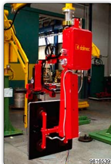
Ruční manipulátor s pneumatickým drapákem k uchopení a naklápění vnitřních ráků pro myčky nádob.