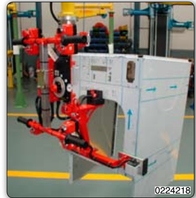
Zařízení k manipulaci s korpusy praček. 0224218