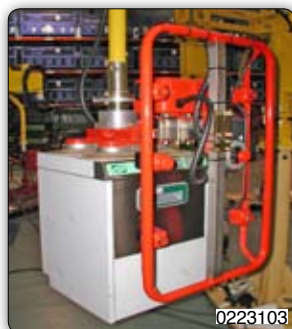
Přisavní zařízení k uchopení a naklápění konvektorů o 90°.