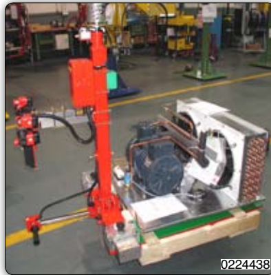
Vidlicové zařízení k uchopení a manipulaci s korpusy chladniček (panel kompresoru na výměnu tepla). 0224438