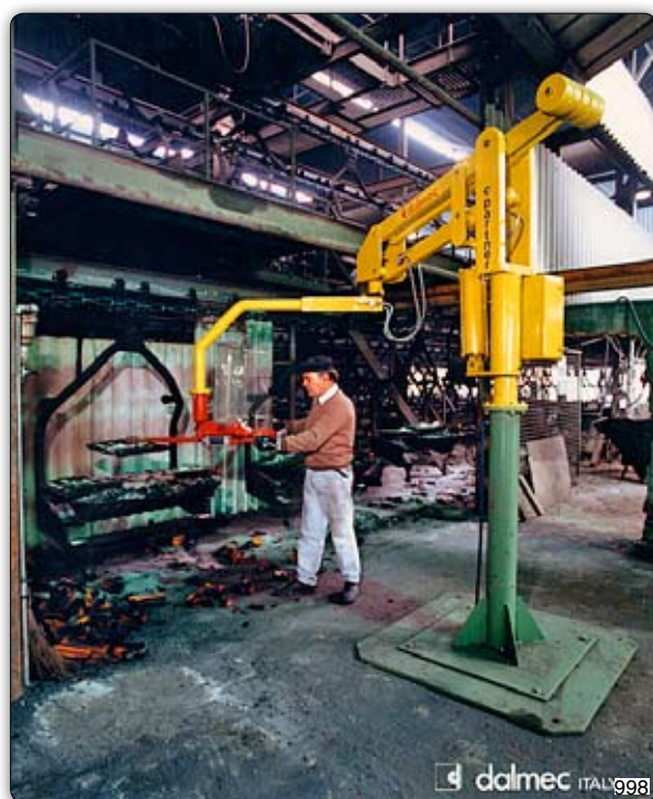
Ruční manipulátor „Partner“ typ PMC, sloupový přístroj, s pneumatickým úchopním zařízením k manipulaci s přesnými odlitky.