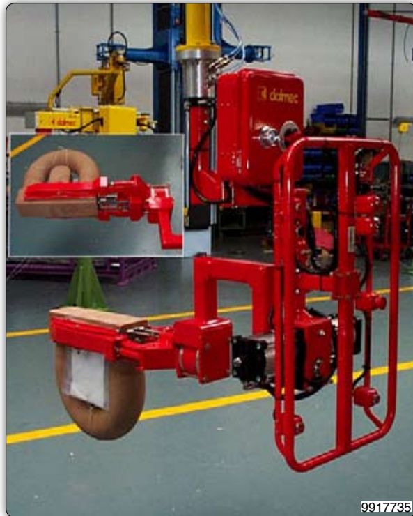
Ruční manipulátor s pneumatickým drapákem pro uchopení a překládání dílů kotle.