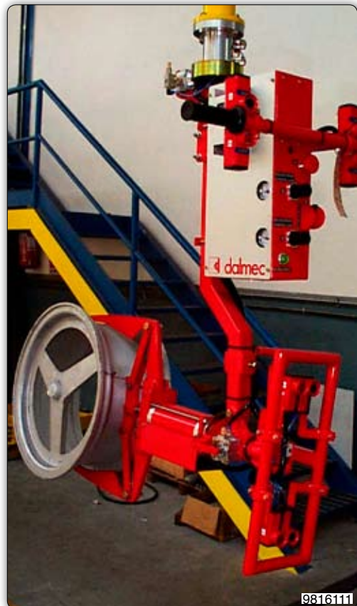
Ruční manipulátor s drapákem k uchopení hliníkových disků. Úchopní zařízením je ručně otočné.