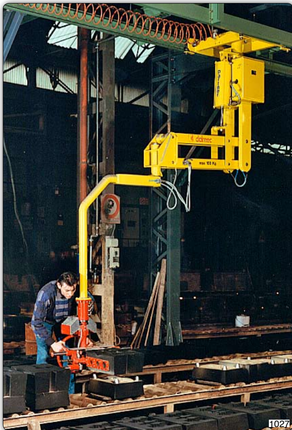
Ruční manipulátor „Partner“ typ PMS, stropní přístroj pojezdňý, s drapákem k uchopení licích forem.