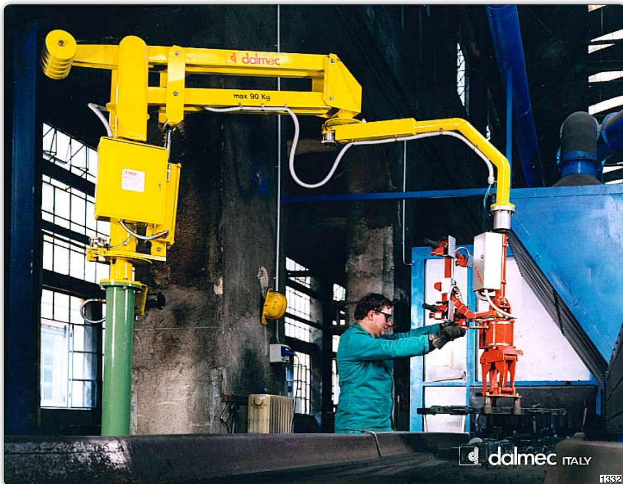
Ruční manipulátor „Partner“ typ PMC, sloupový přístroj, s pneumatickým úchopním zařízením pro manipulaci s odlitky.