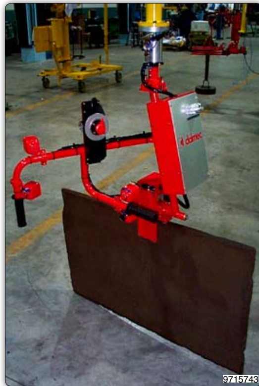
Ruční manipulátor s pneumatickým úchopním zařízením k manipulaci se šamotovými deskami.