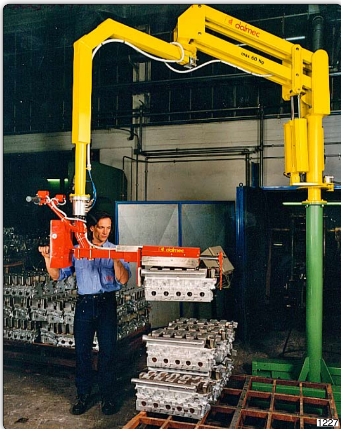
Ruční manipulátor „Partner“ typ PMC, sloupový přístroj, s úchopním zařízením k manipulaci s hliníkovými bloky válců.