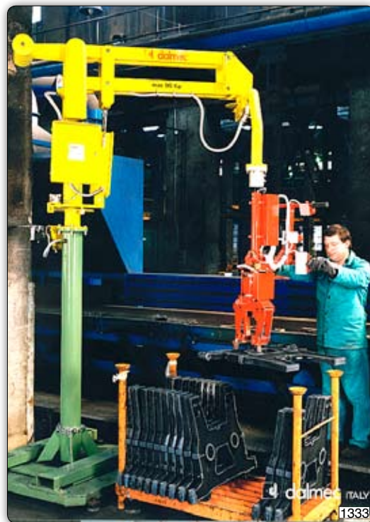
Ruční manipulátor „Partner“ typ PMC, sloupový přístroj s pojízdní základovou deskou, s pneumatickými čelistmi drapáku pro manipulaci s odlitky.