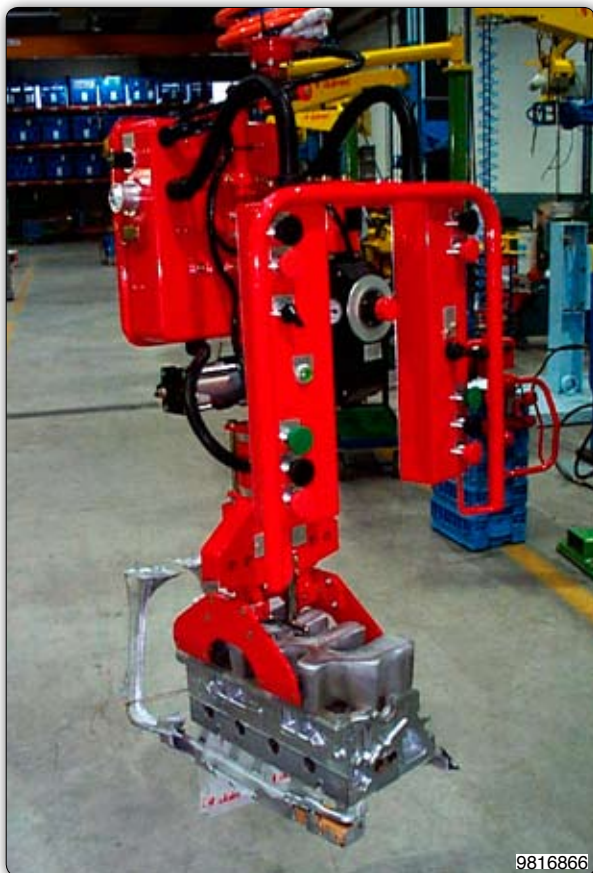
Ruční manipulátor s pneumatickým drapákem pro uchopení a otáčení hliníkových hlav válců.