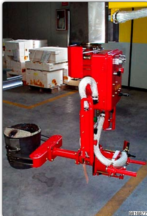
Ruční manipulátor s pneumatickým úchopním zařízením pro manipulaci s licími pánvemi. Úchopní zařízení je ručně otočné.