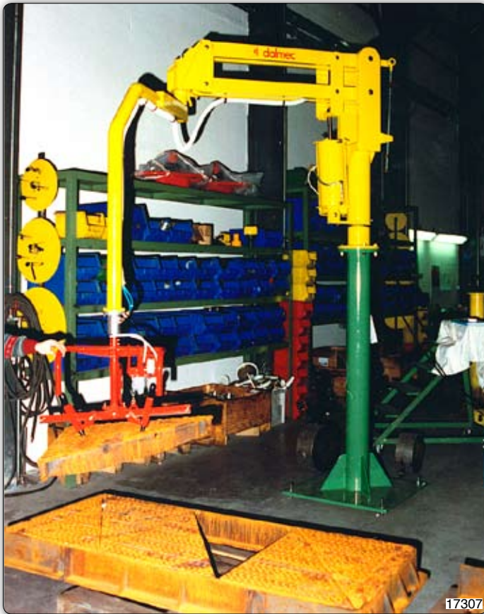
Ruční manipulátor „Partner“ typ PMC, sloupový přístroj, s úchopním zařízením k manipulaci s litinovými poklopy.