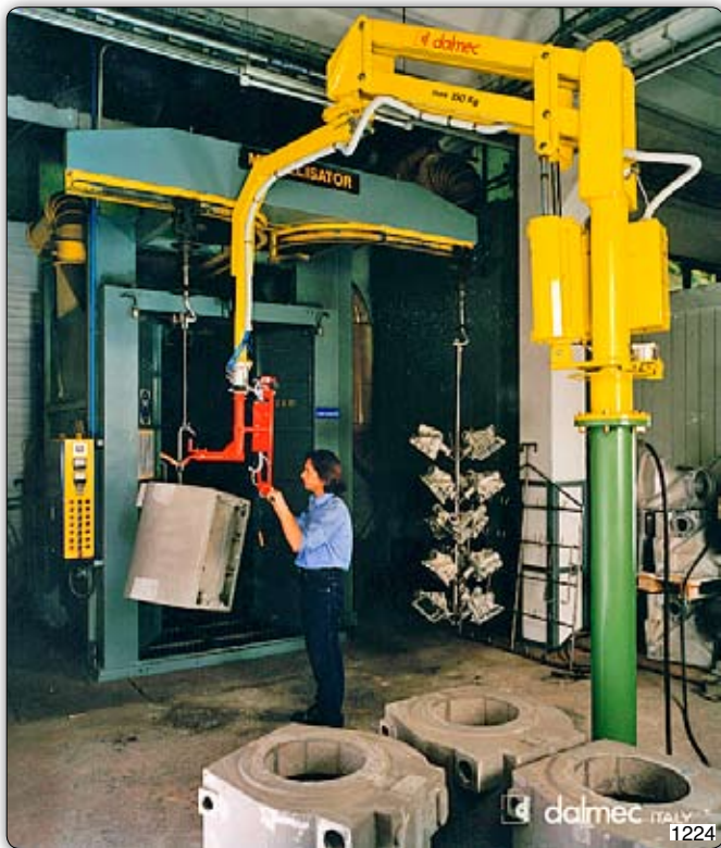
Ruční manipulátor „Partner“ typ PMC, sloupový přístroj, se speciálním hákem pro překládání odlitků.