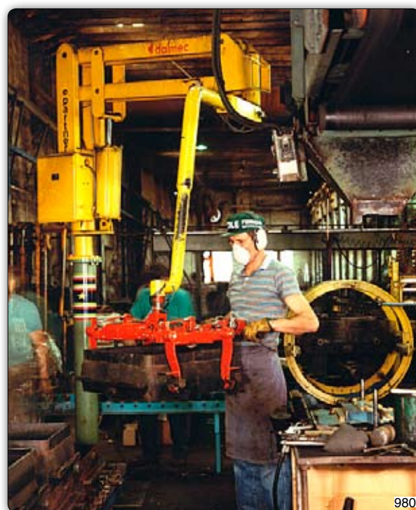
Ruční manipulátor „Partner“ typ PMC, sloupový přístroj, s pneumatickým úchopním zařízením k manipulaci s jaderníky.