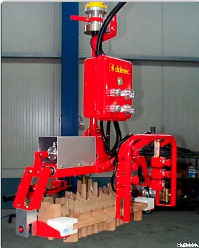
Ruční manipulátor s pneumatickým drapákem k uchopení litinových jader a manipulaci s nimi.