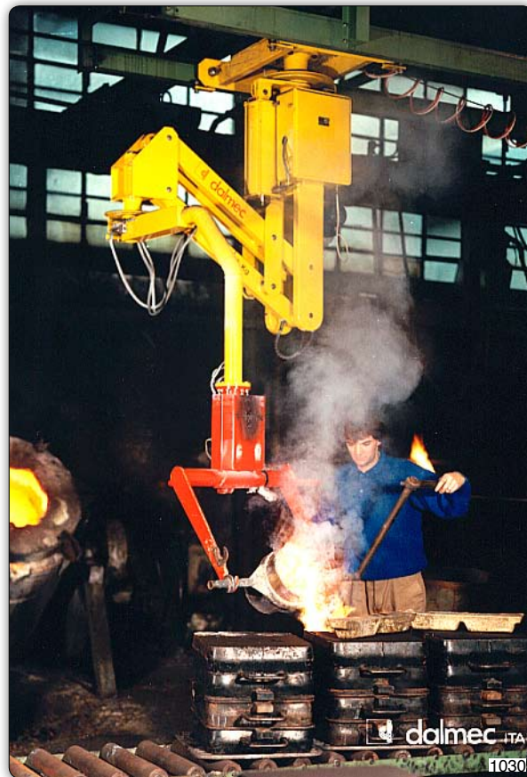
Ruční manipulátor „Partner“ typ PMS, stropní přístroj pojezdňý, s vidlicovým zařízením k manipulaci s licími pánvemi nebo licími kelímky.