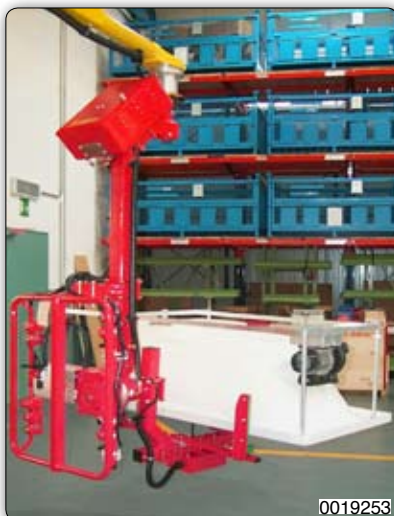
Ruční manipulátor s přísavním zařízením (Venturi) k uchopení a otáčení van.