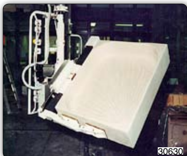
Ruční manipulátor s pneumatickým drapákem k uchopení a otáčení sprchových van. 30630