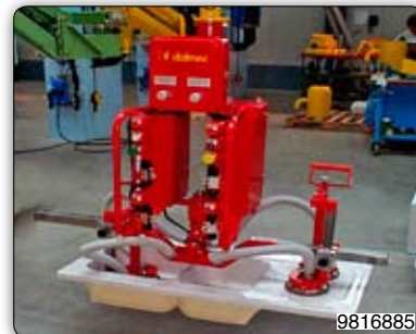
Ruční manipulátor s drapákem pro uchopení sanitárních zařízení, pro uložení do kartonů, jakož i uchopení kartonů a jejich ukládání na paletu.