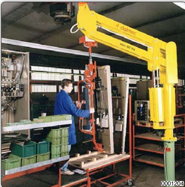
Přísavní zařízení pro manipulaci a pneumatické anebo ruční nakládění/otáčení různých typů produktů.