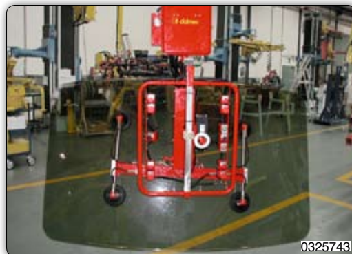
Ruční manipulátor s přísavním zařízením k manipulaci a pneumatickému naklápění dveří a oken. Přísavku je možné ručně nastavit.