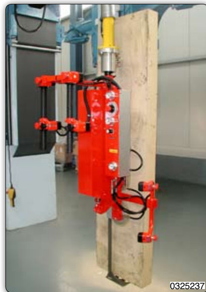
Ruční manipulátor „Partner“ typ PMC, sloupový přístroj s úchopným zařízením s nastavitelnou přísavkou k manipulaci s platněmi.