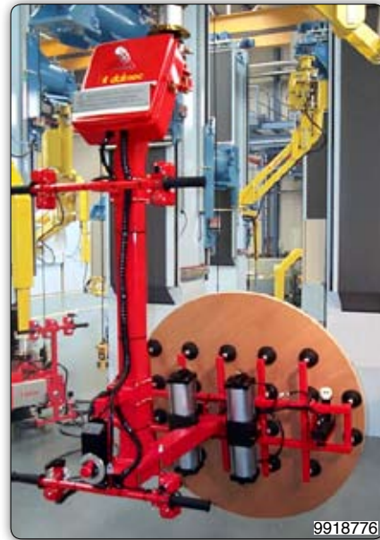
Ruční manipulátor „Partner“ typ PMC, sloupový přístroj s přísavným zařízením k uchopení třískových platní z palety a odložení do dřevoobráběcího stroje.