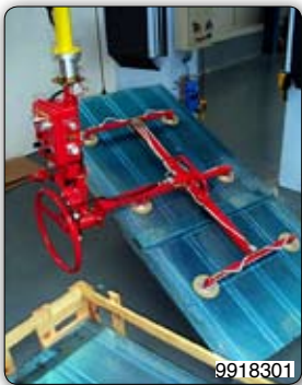
Ruční manipulátor „Partner“ typ PMS, stropní přístroj pojezdový s pneumatickou hnací jednotkou, s nastavitelnou přísavkou k manipulaci a nakládění velkých platin.