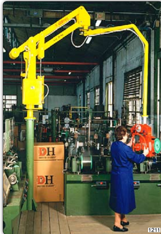
Ruční manipulátor „Partner“ typ PMC, sloupový přístroj s drapákem pro uchopení cívek s drátem na vnějším průměru.