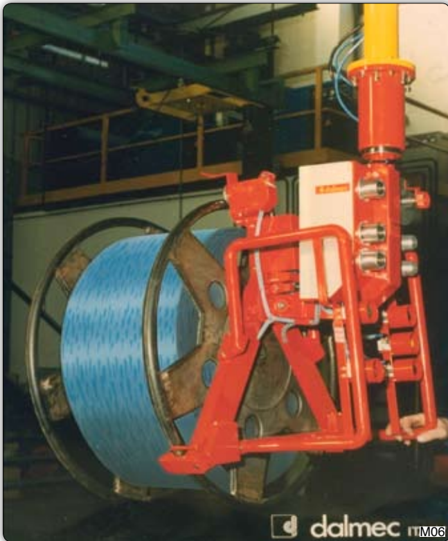
Pneumatický systém k uchopení cívek s ocelovým drátem a manipulaci s nimi. Uchopení se provádí za přírubu a naklápění cívky z horizontálního do vertikálního směru pomocí dvou pneumatických válců.