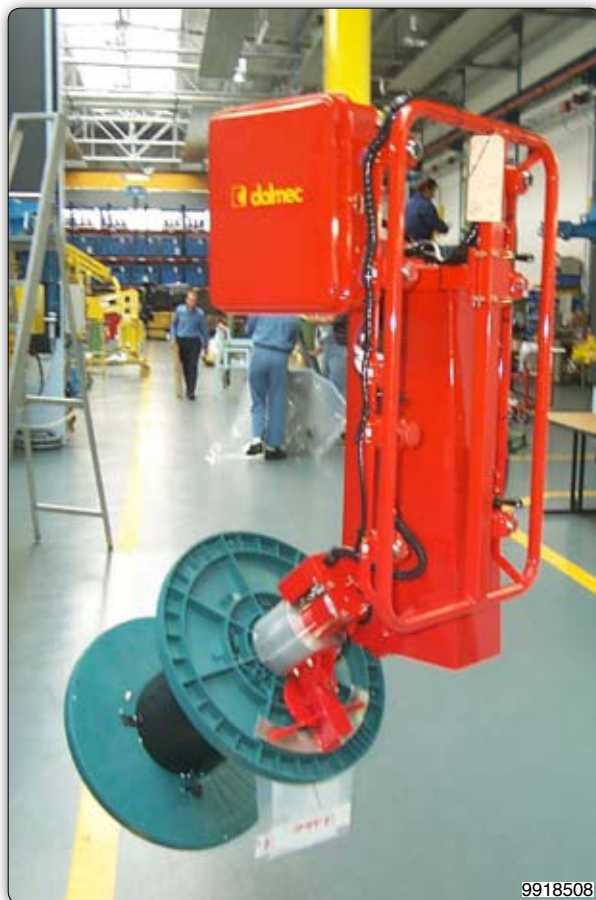
Ruční manipulátor se speciálním úchopním zařízením pro cívký. Uchopení se současně děje pomocí pevného opěrního ramena a pneumatického jistění na přírubě. Ruční otáčení o 90°.