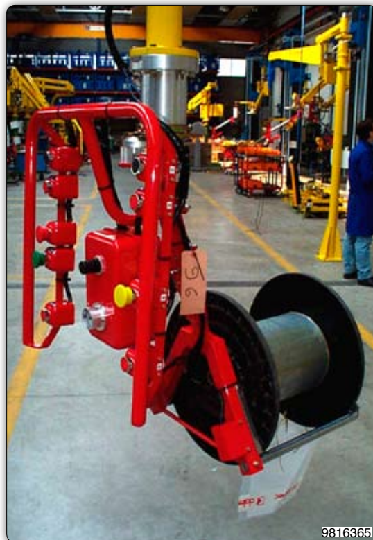
Ruční manipulátor s vidlicovým zařízením pro uchopení cívky pod přírubou a senzory pro rozlišení produktu.