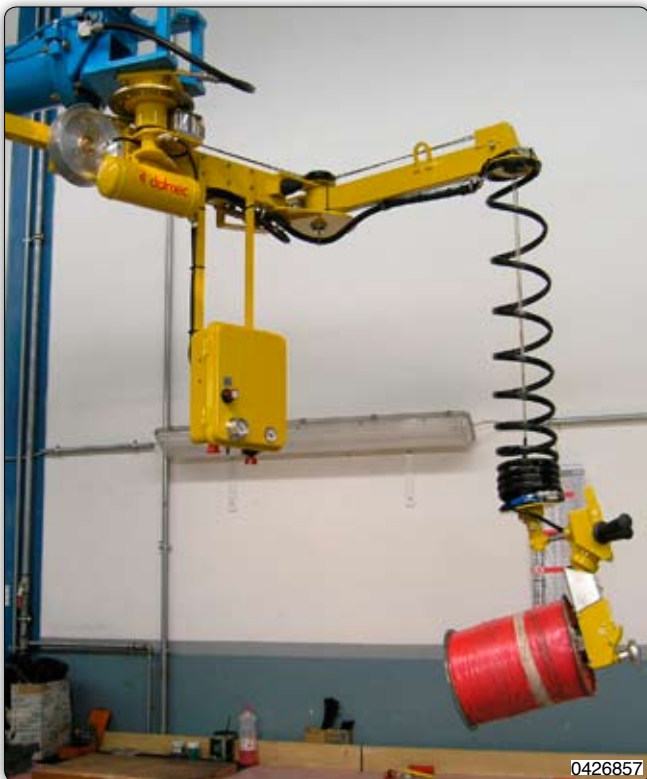
Ruční manipulátor „Speedyfil“ typ SPF, stropní přístroj stacionární s vnitřním rozpínacím trnem a manuálním otáčením o 90°. Úchopní zařízení umožňuje uchopení a odložení cívek.