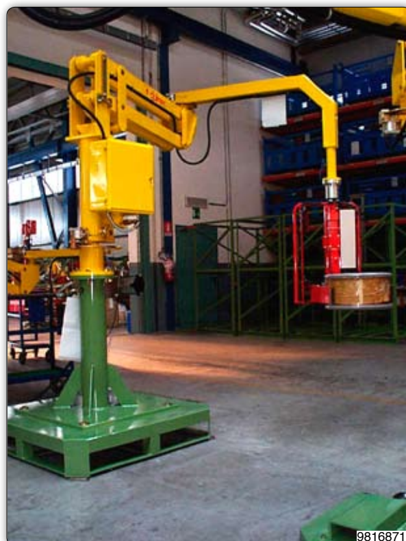
Ruční manipulátor „Partner“ typ PMC, sloupový přístroj s pneumatickým úchopním zařízením. Cívky s ocelovým drátem se přírubou uchopí a pneumaticky naklopí o 90°.