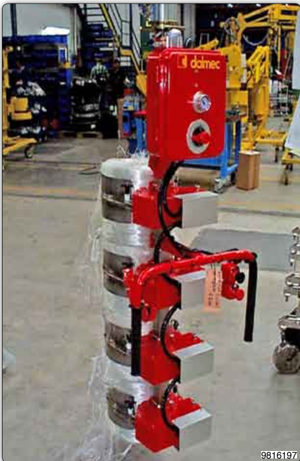
Handhabungs-Manipulator mit vier Greifgruppen für die gleichzeitige Aufnahme von Glasfaserspulen.