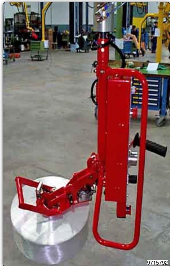
Handhabungs-Manipulator mit pneumatischem Spreizdorn für Faserspulen. Die Spulen werden im Innendurchmesser aufgenommen und von der Horizontalen in die Vertikale manuell gedreht oder umgekehrt.