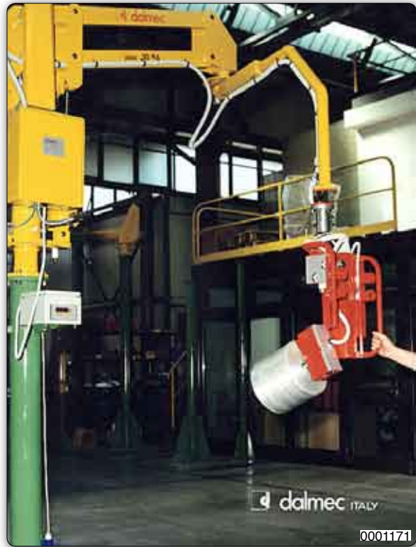
Handhabungs-Manipulator "Partner" Typ PMC, Säulengerät mit pneumatischem Spreizdorn zur Aufnahme und pneumatischer Schwenkung um 90° der Spulen. Der Manipulator ist mit einer Wiegezeile zur Kontrolle der Spulengewichte bei der Aufnahme ausgestattet.