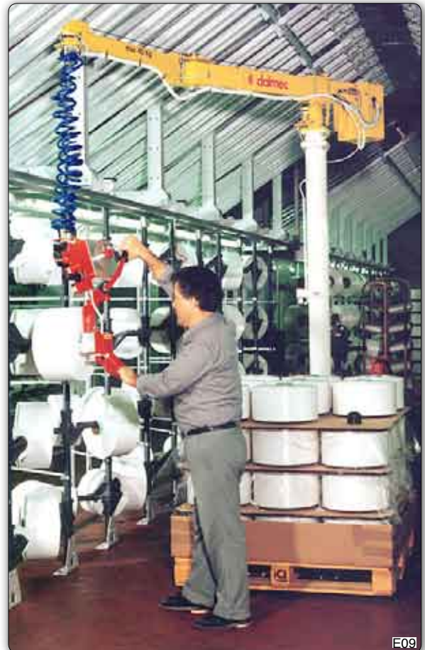
Handhabungs-Manipulator mit pneumatischem Spreizdorn. Die Spulen werden im Innendurchmesser aufgenommen und von der Horizontalen in die Vertikale, oder umgekehrt, manuell gedreht.