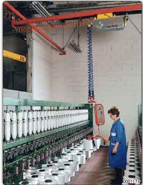
Handhabungs-Manipulator "Minipartner" Typ MPS, Deckengerät an Querbrücke verfahrbar mit pneumatischer Greifvorrichtung zur Aufnahme und Handhabung von Spulen.