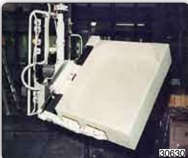
Handhabungs-Manipulator mit pneumatischer Greifvorrichtung zur Aufnahme und Drehung von Duschplatten.