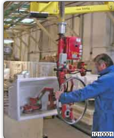
Handhabungs-Manipulator mit Saugvorrichtung zur Aufnahme und Schwenkung von Spülbecken.