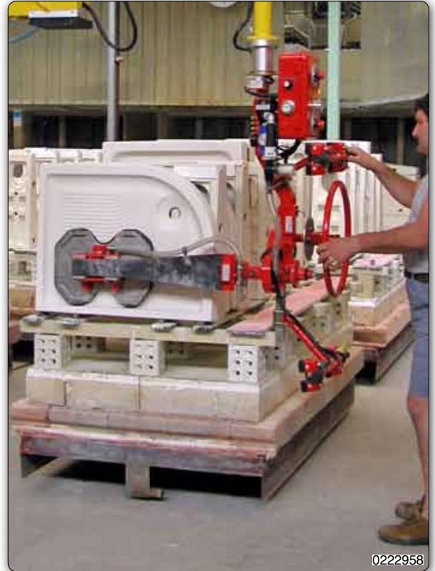
Handhabungs-Manipulator Typ PMF, Deckengerät, mit Saugvorrichtung (Venturi) zur Aufnahme und manuellen Drehung von Duschplatten.