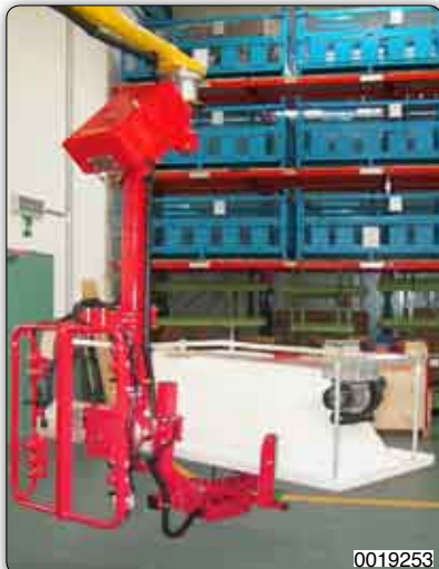
Handhabungs-Manipulator (Venturi) zur Aufnahme und Drehung von Badewannen.