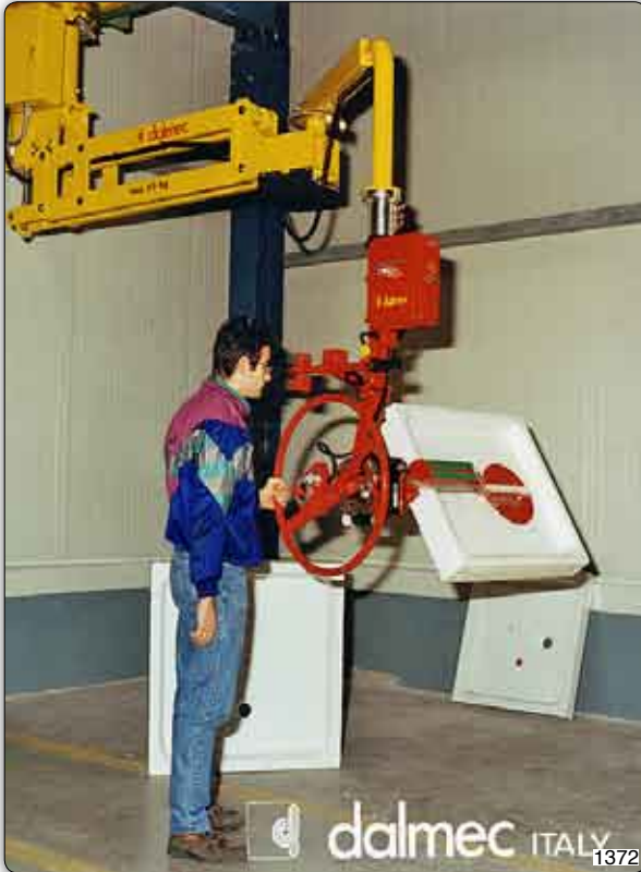
Handhabungs-Manipulator Typ PMF, Deckengerät, mit Saugvorrichtung (Venturi) zur Aufnahme und manuellen Drehung von Duschplatten.