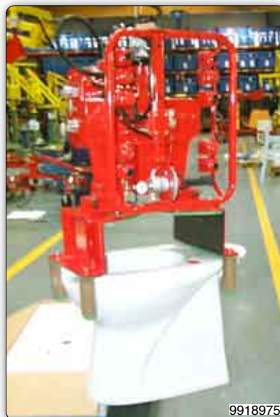
Handhabungs-Manipulator mit Saugvorrichtung (Venturi) zur Aufnahme und manuellen Drehung von Waschbecken.