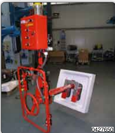
Handhabungs-Manipulator mit Saugvorrichtung (Venturi) zur Aufnahme der Duschplatten.