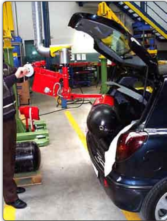
Manipulador con implemento a ventosa (Venturi) regulables para la toma y la manipulación de depósitos.