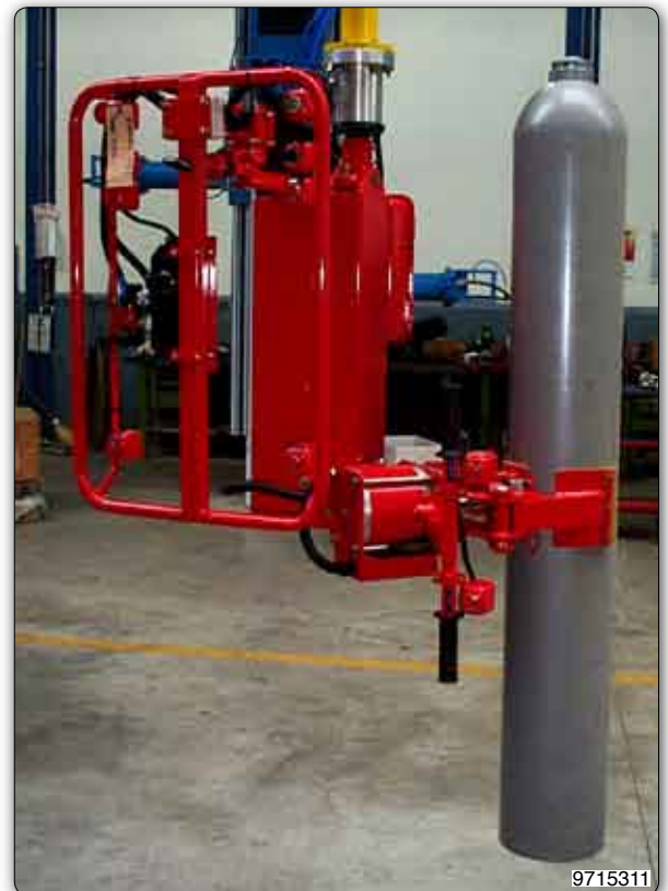
Manipulador con pinza neumática para la toma, la inclinación neumática de 90° y la rotación manual de 180° de bombonas de medidas diferentes.