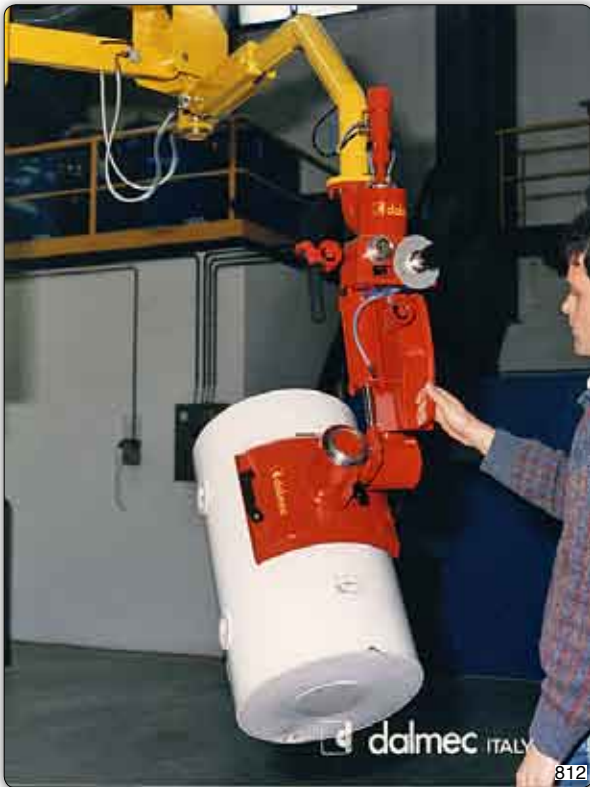
Manipulador Partner tipo PMC a columna, equipado de un implemento a ventosa (Venturi) para la toma y la rotación manual de calderas.