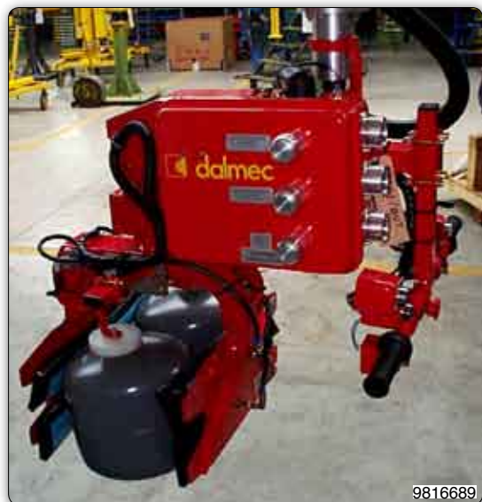
Manipulador equipado con pinza neumática para la toma y la inclinación neumática de 90 ° de bombonas de diferentes medidas.