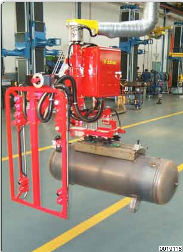
Manipulador con un implemento a ventosa (Venturi) para la toma y la manipulación de depósitos.