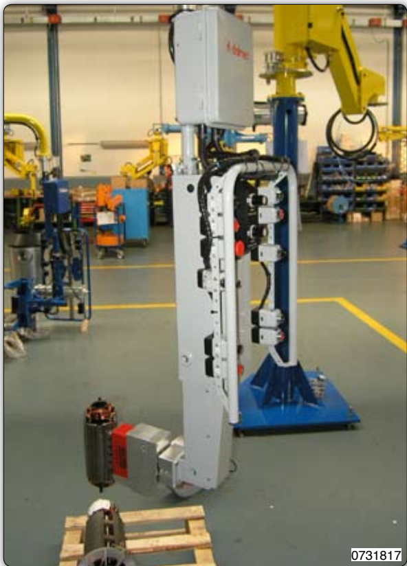
Manipolatore corredato di attrezzo a magnete per presa sul diametro esterno di rotori con inclinazione pneumatica.