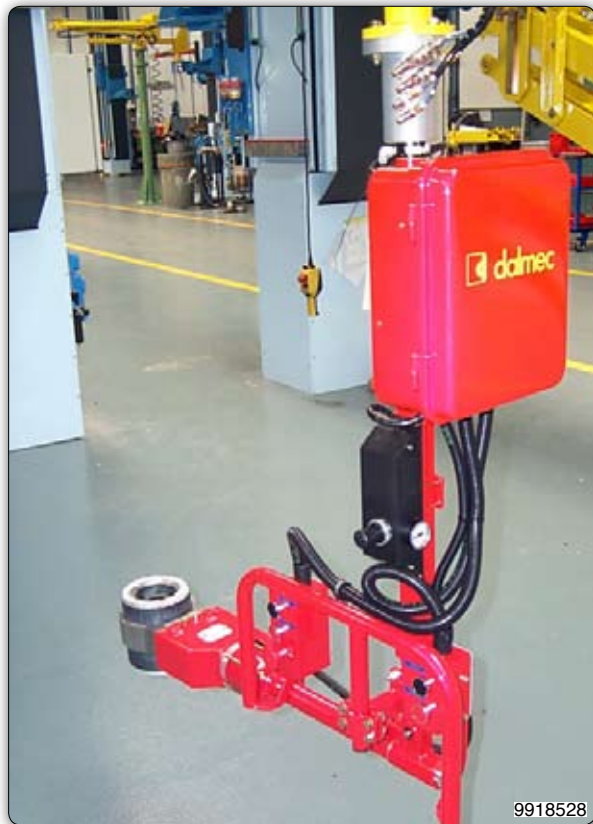
Manipolatore corredato di attrezzo a ganasce per presa sul diametro esterno di rotori.