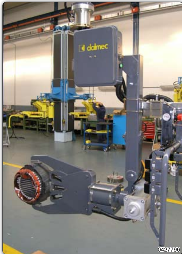
Manipolatore corredato di attrezzo a ganasce per presa e movimentazione di motori elettrici.