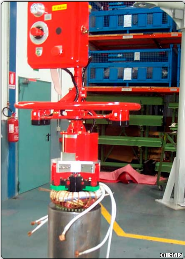
Manipolatore corredato di attrezzo a ganasce per presa sul diametro interno di statori.