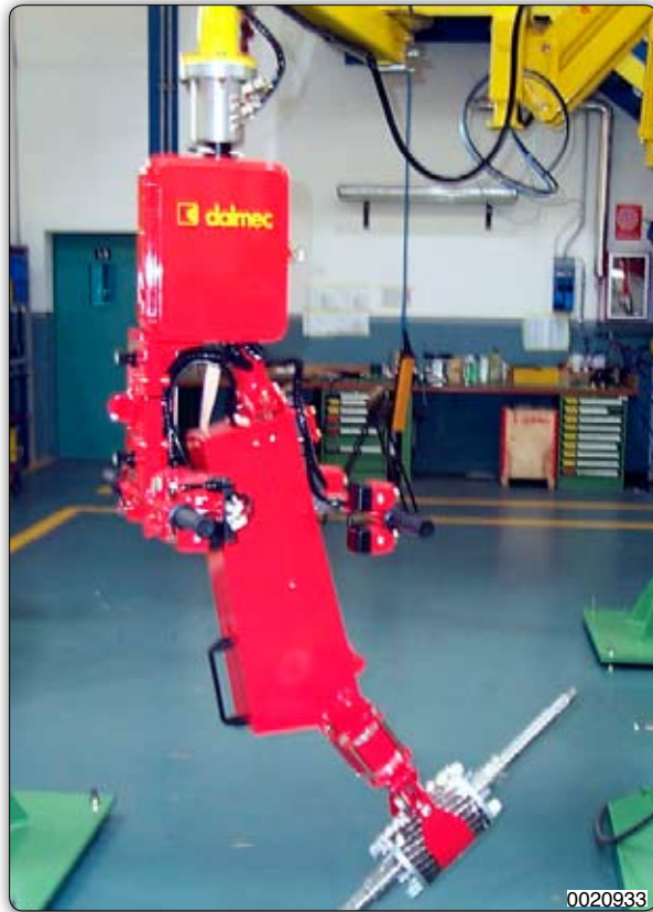
Manipolatore corredato di attrezzo a ganasce per presa sul diametro esterno di rotori con inclinazione pneumatica.