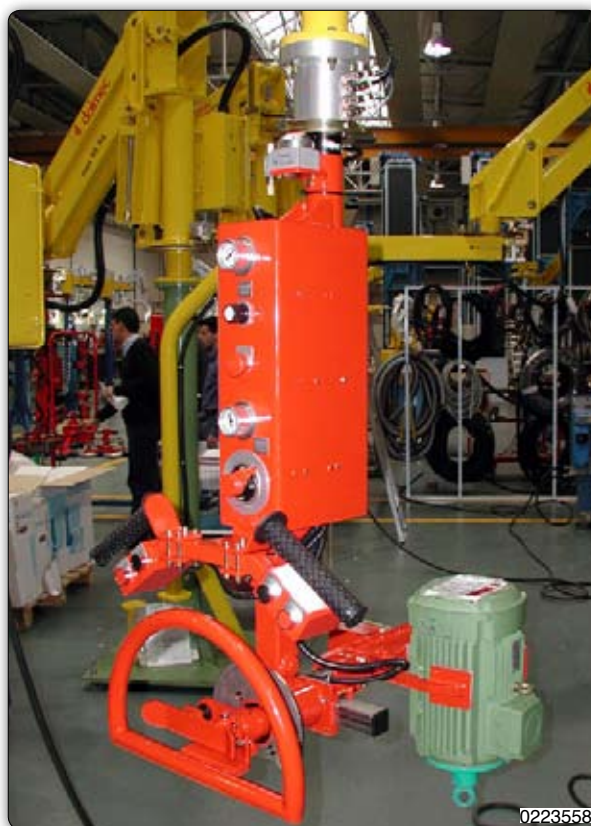
Manipolatore corredato di attrezzo a ganasce per presa sul diametro esterno di statori elettrici, con rotazione ed inclinazione manuale della statore.