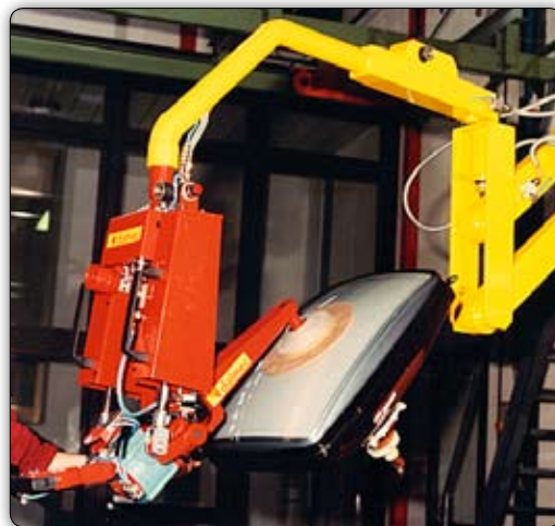
Манипулятор с приспособлением с присосами ("Venturi") для захвата, наклона, поворота электроннолучевых трубок.