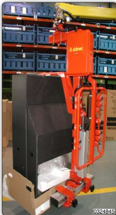
Манипулятор с вилчатым приспособлением для перемещения упакованных телевизоров.