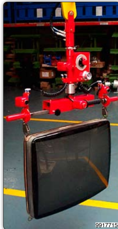
Манипулятор с крюковым приспособлением с регулируемым межосевым расстоянием между крюками для перемещения кинескопа с захватом за суппорт.