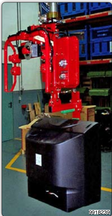
Манипулятор с приспособлением с присосами для перемещения телевизоров с захватом за экран и его помещения в упаковку.