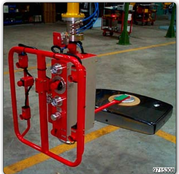
Манипулятор с приспособлением с присосами для захвата и перемещения телевизоров с ж/к экранами.