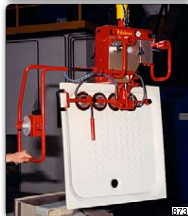
Манипулятор с приспособлением с присосами ("Venturi") для захвата и перемещения душевых поддонов.