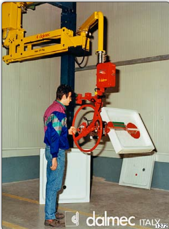
Манипулятор Partner типа PMF в подвесном исполнении с приспособлением с присосами ("Venturi") для захвата, поворота вручную и перемещения душевых поддонов.