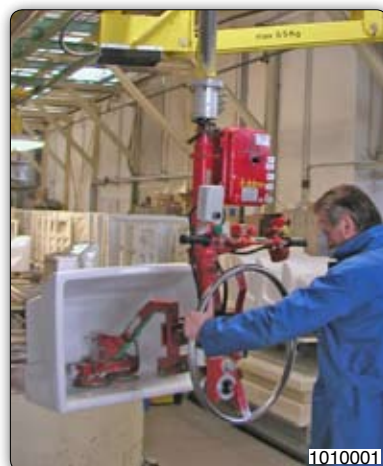
Манипулятор с приспособлением с присосами (Venturi) для захвата и наклона моек.