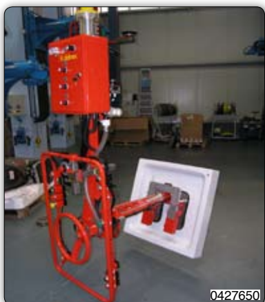
Манипулятор с пневматическим зажимом для захвата и перемещения душевых поддонов.