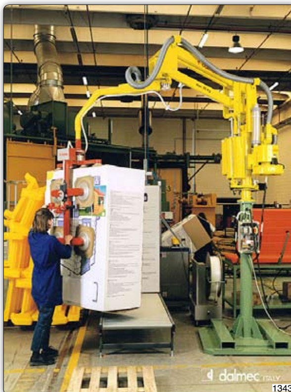
Манипулятор Partner типа PMS в исполнении на стойке, оборудованный приспособлением с присосами и предназначенный для захвата и перемещения картонных коробок с линии упаковки на поддоны.