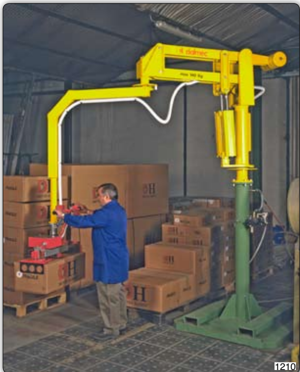
Манипулятор Partner типа PMS в исполнении на стойке, оборудованный приспособлением для захвата с зажимами и предназначенный для укладки запакованных картонных коробок на поддон.