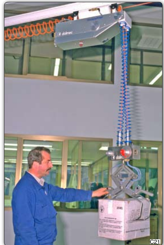
Манипулятор Partner типа MPS в подвесном передвижном исполнении на траверсе, оборудованный пневматическим приспособлением с зажимами для захвата и перемещения коробок, имеющих разные размеры и вес. Приспособление для захвата оборудовано пропорциональным клапаном для облегчения оператору поиска соответствующего уравновешивания. Траверса и продольные ходовые пути – нашей разработки.