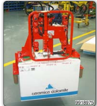
Манипулятор Posifil типа PFC в исполнении на стойке, оборудованный приспособлением для захвата сантехники, ее позиционирования в упаковочные картонные коробки, захвата запечатанных коробок и их разгрузки на поддон.