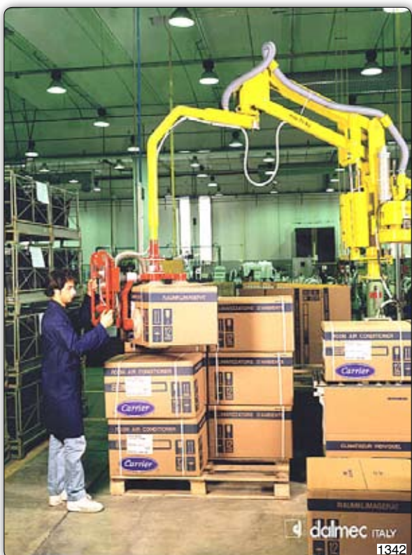
Манипулятор Partner типа PMS в исполнении на стойке с приспособлением для захвата с присосами и предназначенный для перемещения запакованных коробок с линии увязки на поддон.